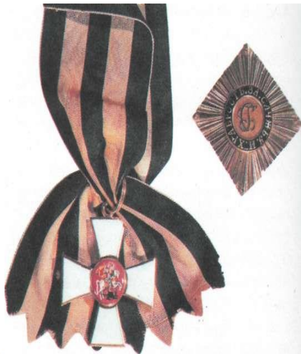
Лента, знак и крест ордена Святого Георгия