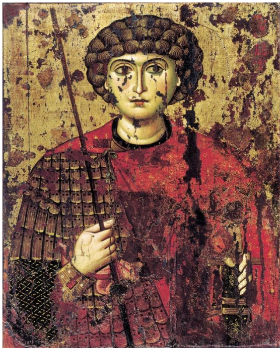
Икона. Святой Георгий Победоносец