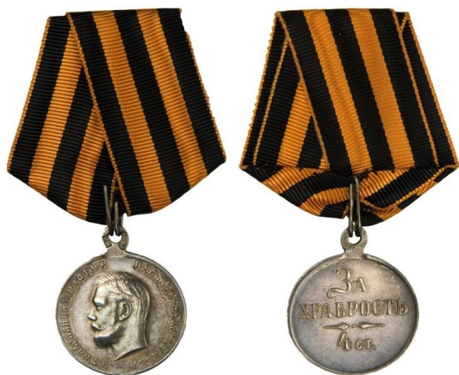
Медаль « За храбрость»