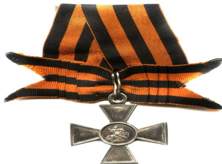
ГК 3 ст. с бантом