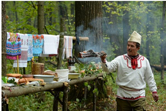
Моления в роце