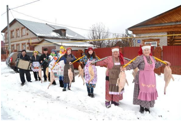
"Каз омэсе" - праздник гусиного пера