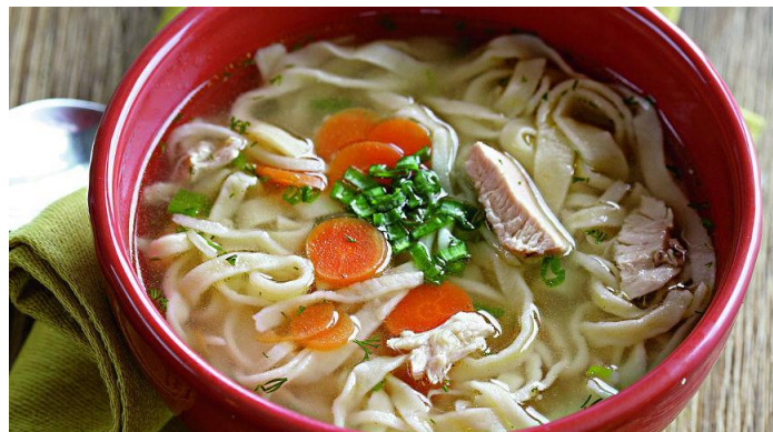
Токмач - суп-лапша