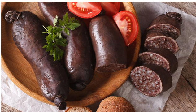
Кровяная марийская колбаса