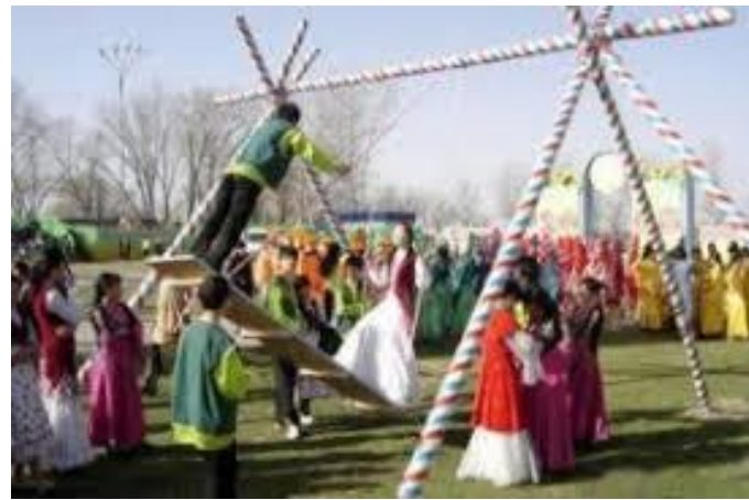
Науруз и Нардуган